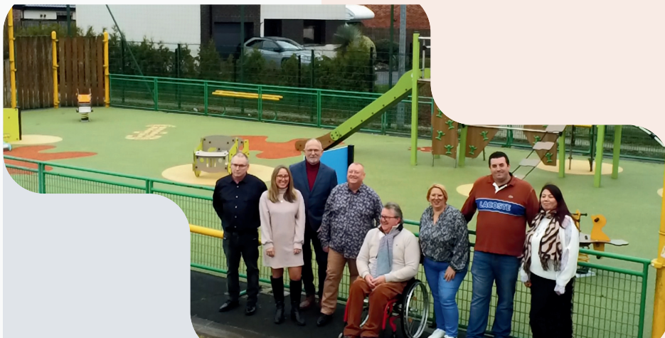
Photo prise devant l'aire de jeux qui se situe à côté du complexe tennistique.

Vos élus, à l'écoute des habitants, ont transformé l'ancien city - stade qui était fortement dégradé et apportait des nuisances en réalisant la première aire de jeux publique.